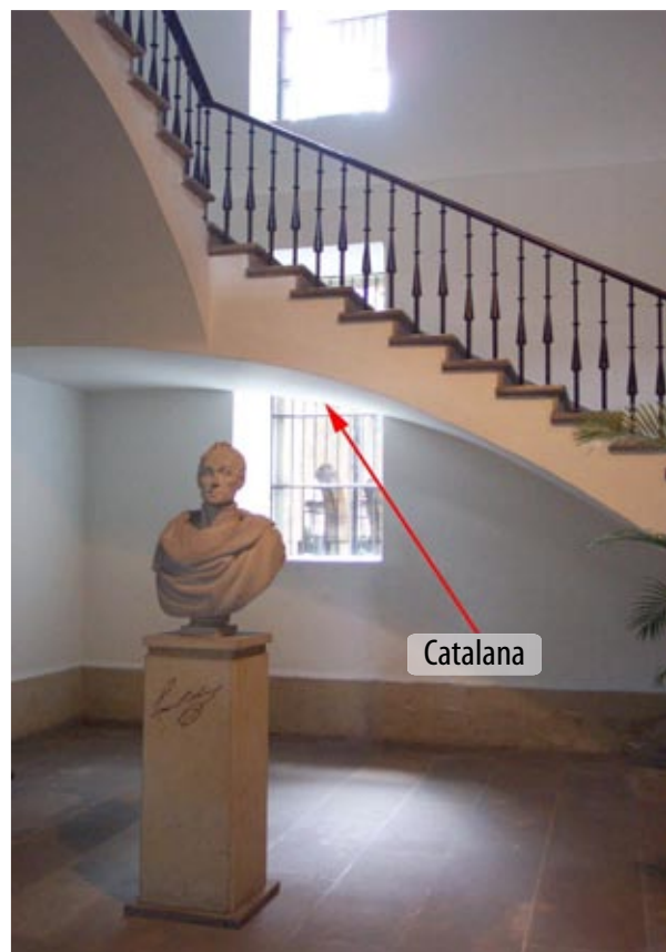
Entrada colección permanente