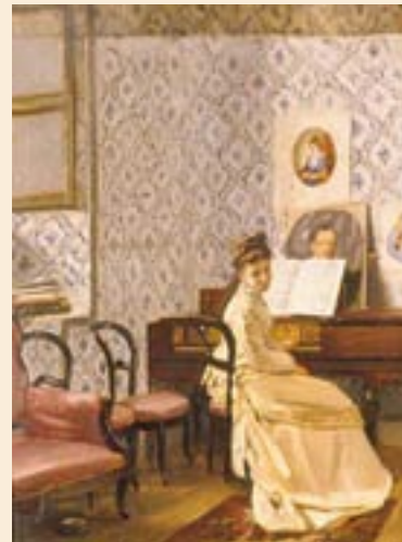
Ramón Torres Méndez Interior santafereño Ca. 1874. Óleo sobre cartón, 35 x 25,4 cm. Reg. 2096 Trasladado del Museo de la Escuela de Bellas Artes de Bogotá (ca. 1948)

Estudiar los cambios que se produjeron en el siglo XIX en los elementos de mobiliario y su función permite hacer una aproximación a la vida cotidiana, las costumbres y el cambio de hábitos que se generaron por la transformación del país. A través de dos obras de la colección del Museo Nacional de Colombia se pueden examinar estos cambios; en primer lugar, la acuarela atribuida a José Manuel Groot [Bogotá, 25.12.1800-3.5.1878] y August Le Moyne [Francia; 1800-ca. 1880] de 1835, que muestra a dos mujeres conversando y fumando, sentadas en una silla; en segundo lugar, el óleo de Ramón Torres Méndez [Bogotá 29.8.1809-16.12.1885], en donde una joven que está tocando el piano voltea a mirar al pintor por un instante. Dos interiores santafereños, separados por cuarenta años en su ejecución, muestran un gran cambio en el espacio y su decoración, en la actitud de los personajes y en la ropa que visten. Pero ¿cómo se suscita este cambio?, ¿responde sólo a una moda o depende de otros factores?, ¿son ámbitos que respondían a necesidades y rituales diferentes?