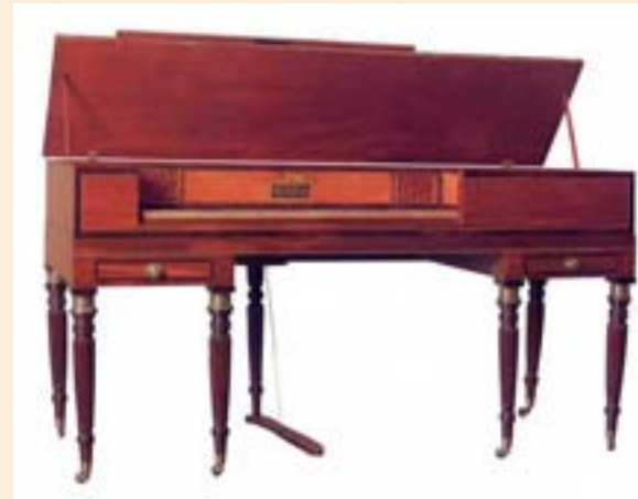
Muzio Clementi (Londres) Piano rectangular Ca. 1812 Colección José Ignacio Perdomo, Banco de la República 8

Aunque tener un piano era de las cosas más costosas por los riesgos de transporte a lomo de mula desde Honda, desde comienzos de siglo se encuentra como un elemento común en todas las casas. La música fue una de las materias que se introdujo desde el comienzo en la educación de la mujer, como una de las actividades propias del bello sexo , y se convirtió en un elemento de distracción en las numerosas veladas a las que la sociedad se comenzó a habituar. El piano podía estar ubicado indistintamente en la sala o en alguno de los salones en los que se recibía y, por lo general, era tocado por las mujeres.