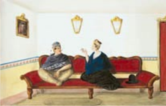
Joseph Brown / José María del Castillo, según José Manuel Groot Charla en Bogotá / El estrado Ca. 1835. Acuarela sobre papel Royal Geographical Society of London, reg. X843/31

lleva otro vestido utilizado para ocasiones informales y descrito en varias ocasiones por viajeros como “un rebozo (mantilla) de material azul, falda de bayeta que es una tela de tejido liviano fabricada en el país y un sombrero de fieltro parecido al de los hombres” 3 . A raíz de las conquistas de Napoleón en el África se impuso el uso de turbantes, que llegaron a Colombia un poco desdibujados, convertidos en pañuelos amarrados en la cabeza.