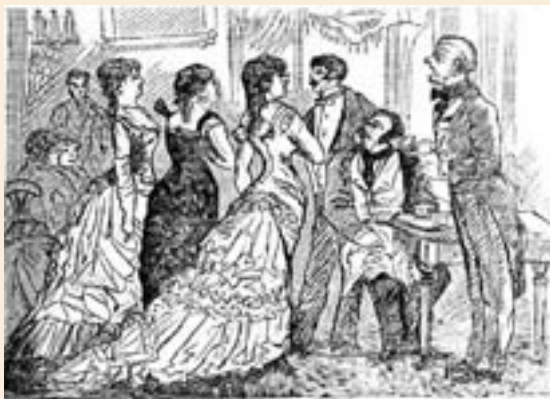
Dibujo de Alberto Urdaneta, grabado de Rodríguez. En: Ricardo Silva. "Un año en la corte". Papel Periódico Ilustrado Bogotá: Imprenta de Silvestre y Compañía, vol. I, 1881.

La moda femenina comenzó a seguir los dictámenes de la francesa: las grandes faldas volvieron a hacer su aparición, pero esta vez sin grandes escotes; no se podía ingresar a una iglesia sin mantilla. Las costumbres establecieron el color negro para las mujeres mayores o para ir a misa y los tonos claros para las jóvenes. A finales de siglo se imponen los trajes con polisón o quitrín, que era un cojín que se colocaba sobre las caderas y recogía una falda que caía al frente, moda que tuvo una corta vida de 10 años, entre 1875 y 1885, y que es el tipo de vestido que viste la joven, seguramente hija del artista, de este Interior santafereño .